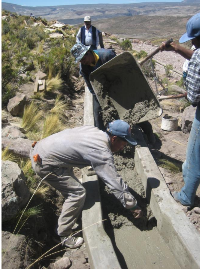
Bau eines Bewässerungskanals von 7 Kilometern. Das Hotel liegt auf 4.000 m. Höhe. Ist eine Antwort auf ein großes Bedürfnis mehrerer Dörfer unserer Region für die Bewässerung der Felder