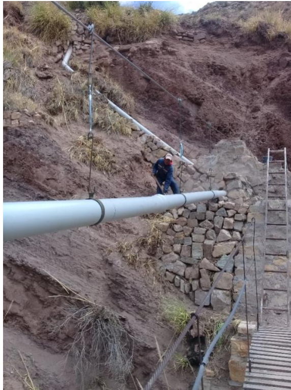
Bewässerungskanal für 3 Dörfer: teilweise Tarapaya, Aroifilia, Tambo Pata Empfang des Wassers einer entfernten Quelle. Eine großartige Arbeit mit 100% Ergebnissen